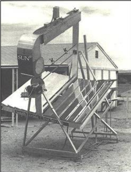
Fresnel reflektor C3 4000

betingelser i perioder på mellem 100 og 8000 timer. Herefter måles egenskabsændringerne.